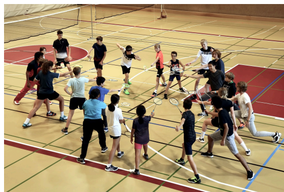
Entraînement des juniors un samedi en septembre 2021

Aujourd'hui, le BC Sierre compte 25 juniors entre 10 et 17 ans, qui se répartissent en 3 groupes : les juniors 1, les juniors 2 et les juniors fun .